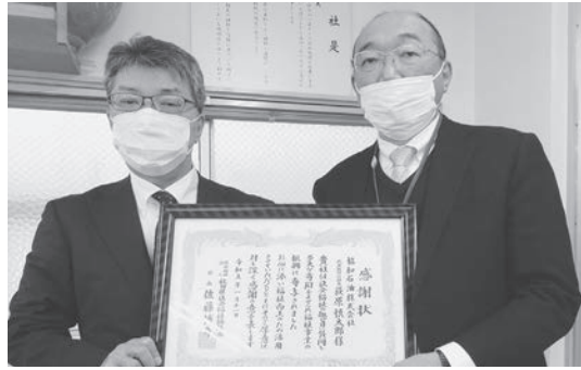
協和石油株式会社 様