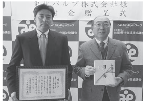
株式会社東北バルブ株式会社 様