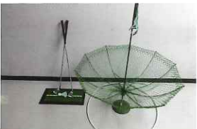
ターゲットバードゴルフ (9ホール)