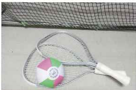
ミニテニス (5セット)