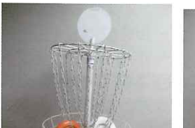
ディスクゴルフ (5セット)