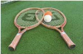
バウンドテニス (2セット)