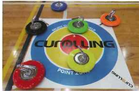
カローリング (2セット)