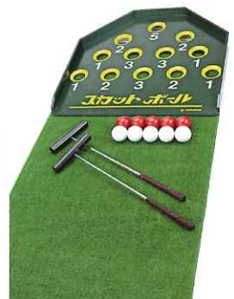
スカットボール (3セット)