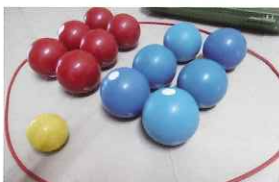
ニチレクボール (10セット)