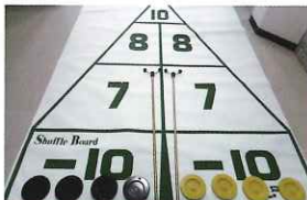
シャフルボード (3セット)