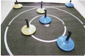
ユニカール (1セット)