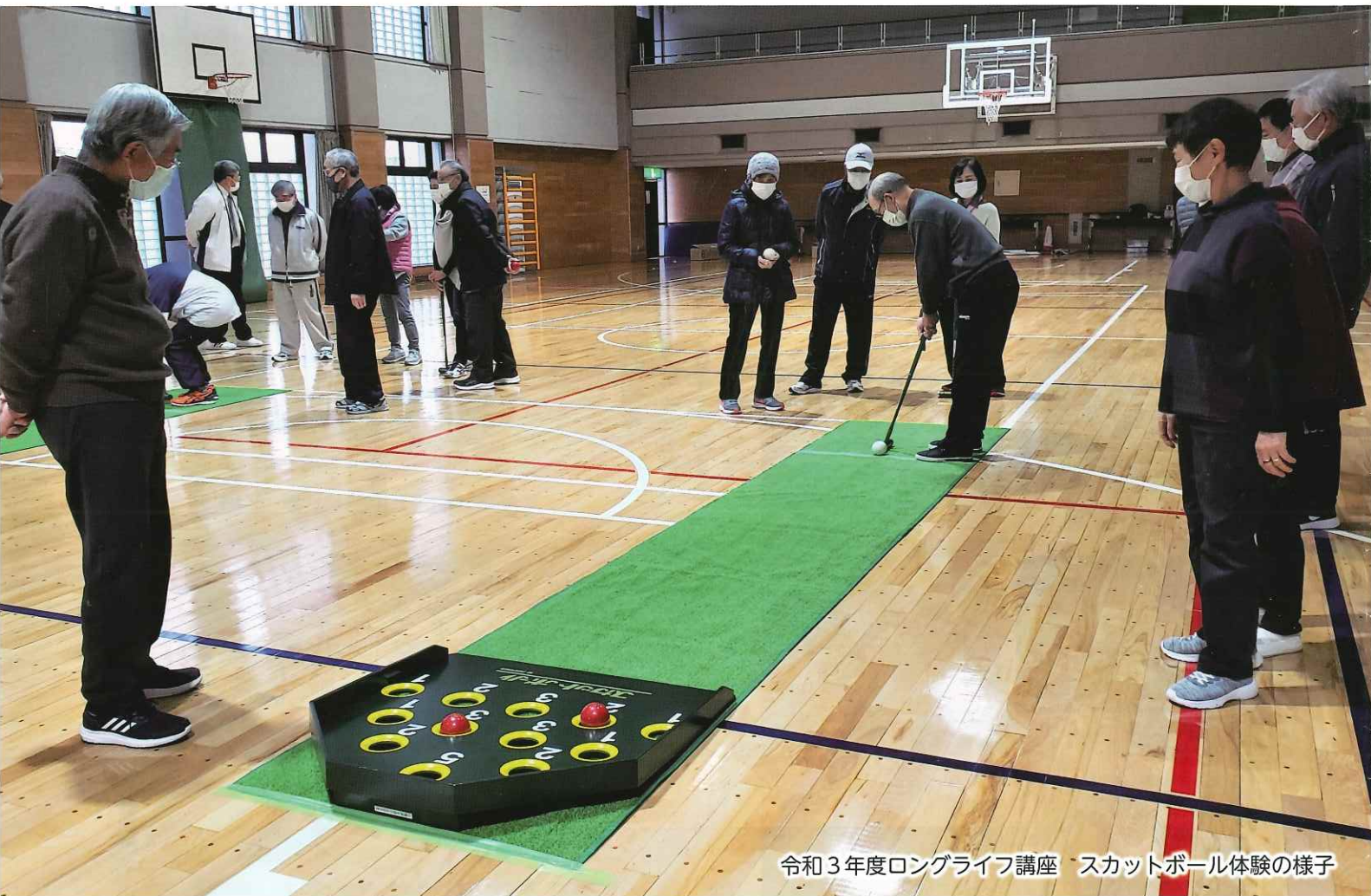
令和3年度ロングライフ講座 スカットボール体験の様子