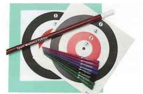
スポーツウエルネス吹矢 (5セット)