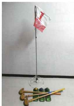
グラウンド・ゴルフ (16ホール)