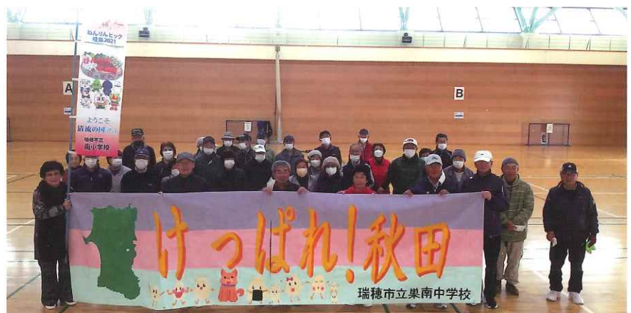
岐阜県内の児童・生徒が作成した応援横断幕、応援のぼりをいきいき長寿あきた2021ねんりんピックで披露しました