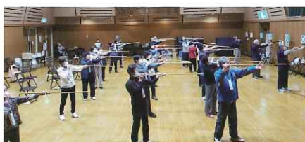
北秋田会場 (スポーツウエルネス吹矢)