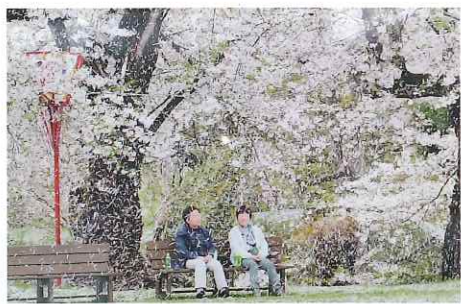
③写真「春 フィナーレ」