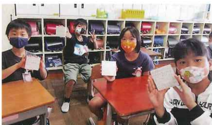
秋田県について学び、メッセージを寄せた岐阜県瑞穂市立生津小学校の皆さん