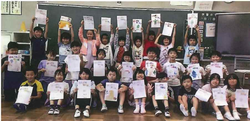
岐阜県瑞穂市立南小学校の皆さんが描いた絵が応援のぼりになりました