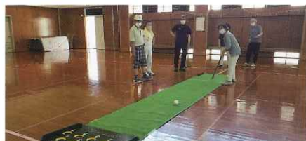
由利本荘会場 (スカットボール)