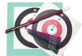
スポーツウエルネス吹矢