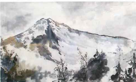
②日本画「鳥海山を望む」