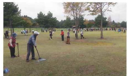
グラウンド・ゴルフ