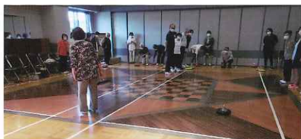
横手会場 (カローリング)