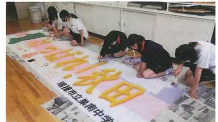
応援横断幕を作成中の岐阜県瑞穂市立巣南中学校の皆さん