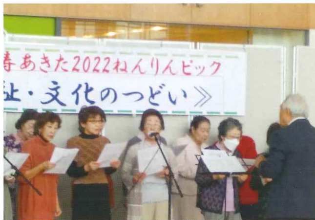
いきいき活動発表 保戸野NHKラジオ歌謡を歌う会