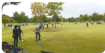
グラウンド・ゴルフ親睦大会