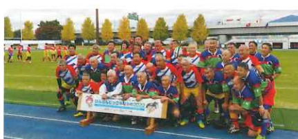
ラグビーフットボール