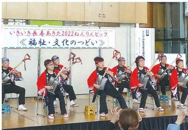
いきいき活動発表 スコップ三味線 ザジーバース