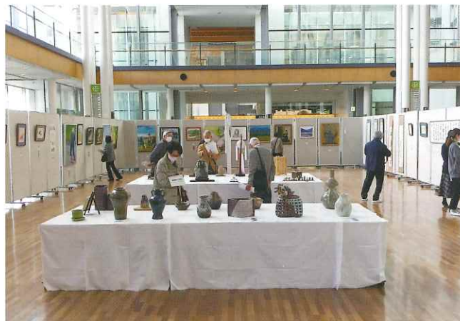
美術展会場の展示②