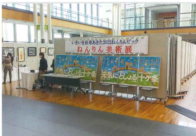
美術展会場の展示①