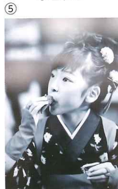
⑤ 【最優秀賞】 写真の部 「至福の時」 高山 明