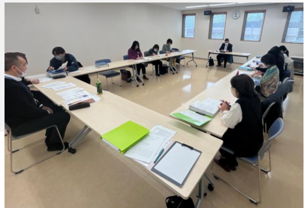
（写真）市内SCが月1回集まり、活動の共有や情報交換を行っている