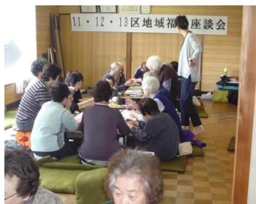
ワークショップの様子②

アンケート結果を踏まえ、社協では住民同士が互いに支え合うことで困りごとを解決する仕組みとして、「町民互助サービス（仮称）」の事業化を計画している。今年度中に試験的に取り組み、その結果に対する住民の意見等を踏まえて平成30年度からの本格的な実施を目指している。