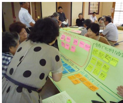
ワークショップの様子①

「福祉」や「まちづくり」は行政の役割だとサービスの限界を理解してもらうとともに、地域にある問題を自分の問題として捉え、自分たちで地域づくりを進めていくという機運を高めることが必要である。