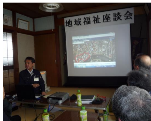
地域の状況を映像化

また、住民向けの介護保険サービス利用までの流れを職員が寸劇を披露して説明するなど、住民が理解しやすいような工夫もしている。