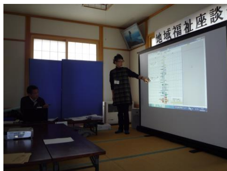
地域の状況をグラフ化

グラフ化したことで、各地域の状況や特徴が数字よりも一目で理解でき、参加者も積極的に地域の現状や課題について発言できる場となっている。